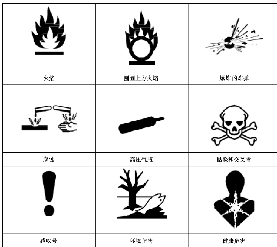
图 1 危险符号