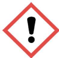
图 2 皮肤刺激物象形图

示例:GB 30000.19 的一个象形图,可用来标识皮肤刺激物等,如图 2 所示。