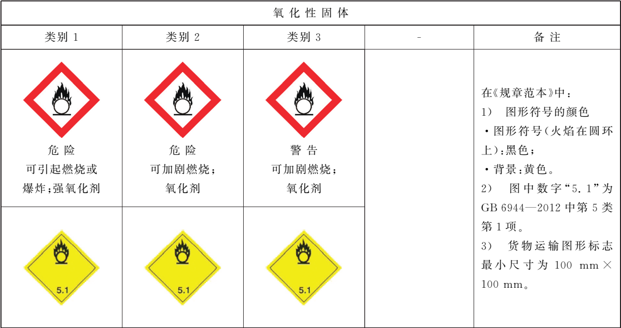
表 B.1 氧化性固体标签要素的分配