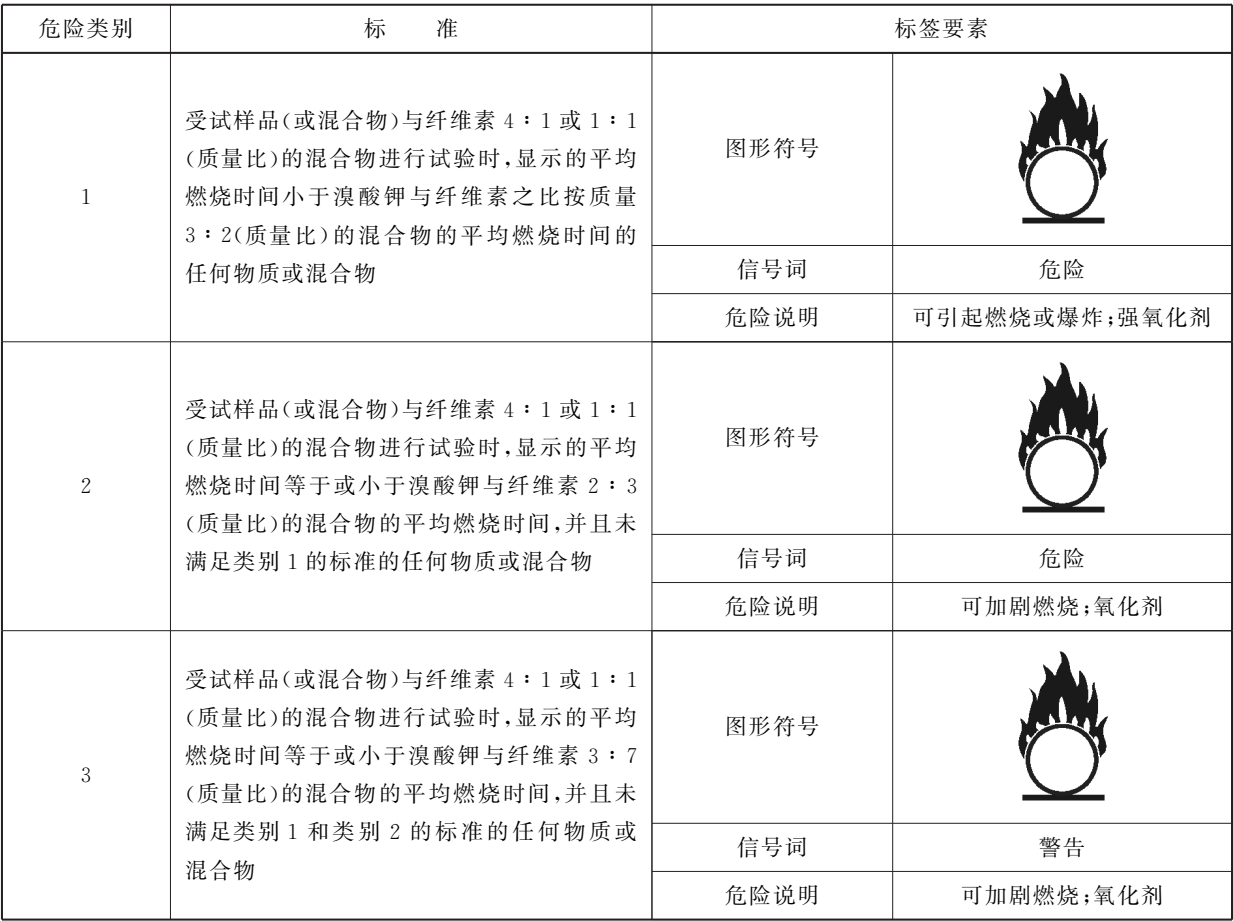
表 C.1 氧化性固体分类标准和标签要素