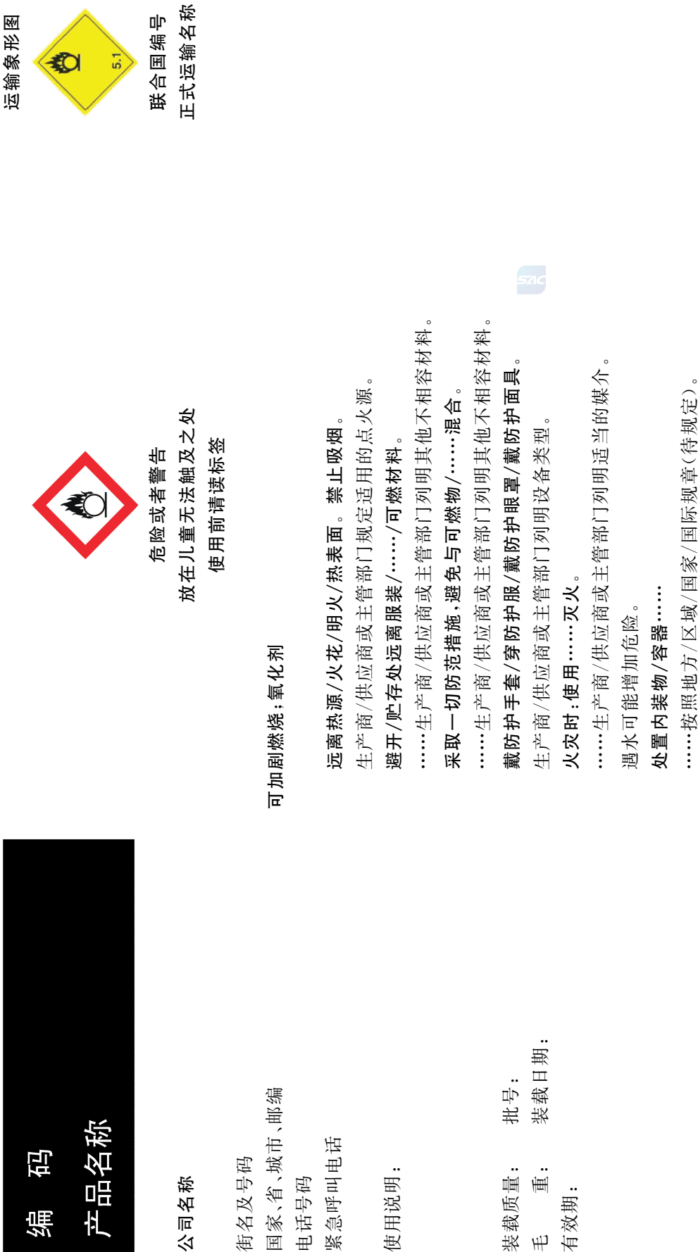
图 E. 2 氧化性固体类别 2 和类别 3 的标签示例