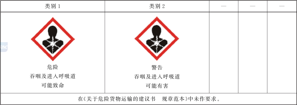
表 C.1 吸入危害的标签要素配置表