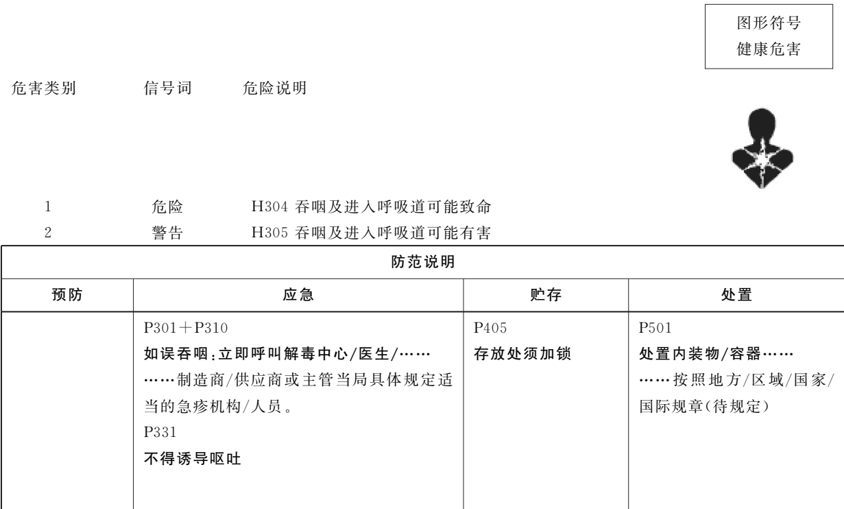
表 E.2 吸入危害防范说明