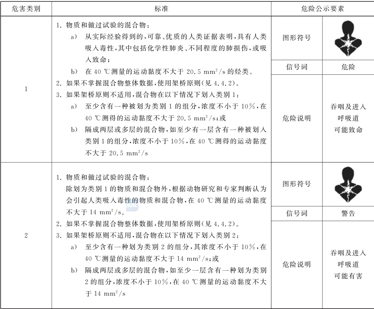
表 D.1 吸入危害分类和标签